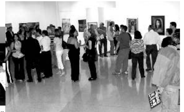
Asistentes al evento