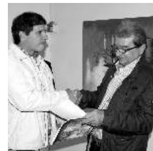
El rector recibió botón y reconocimiento de