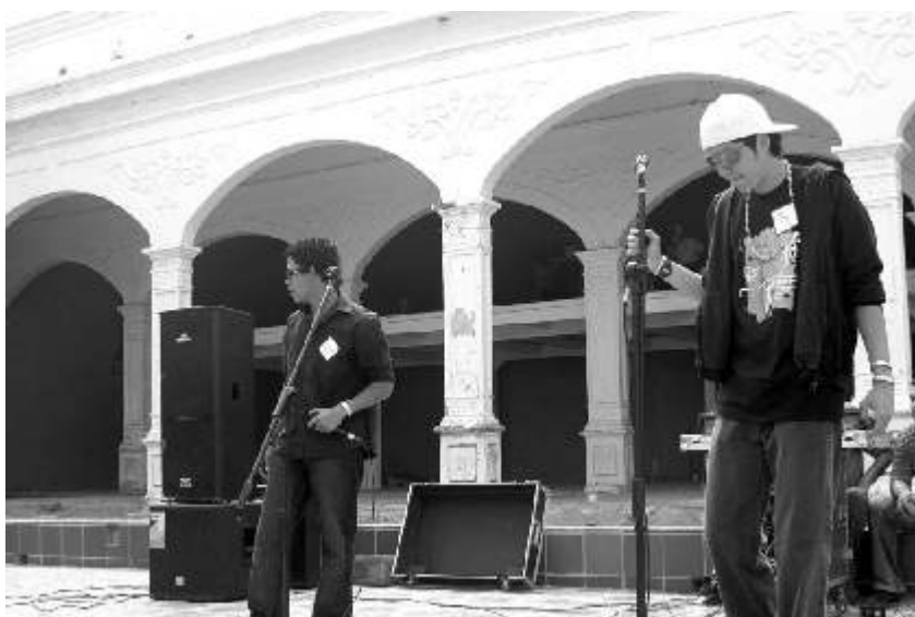
"Fael y Close", grupo de rap integrado por estudiantes del primer semestre de artes plásticas, amenizó la protesta

los cien estudiantes, y ha avanzado hasta el quinto semestre. En una pancarta los estudiantes plasmaron sus manos pintadas de colores y sus firmas, con el propósito de dejar constancia de su protesta.