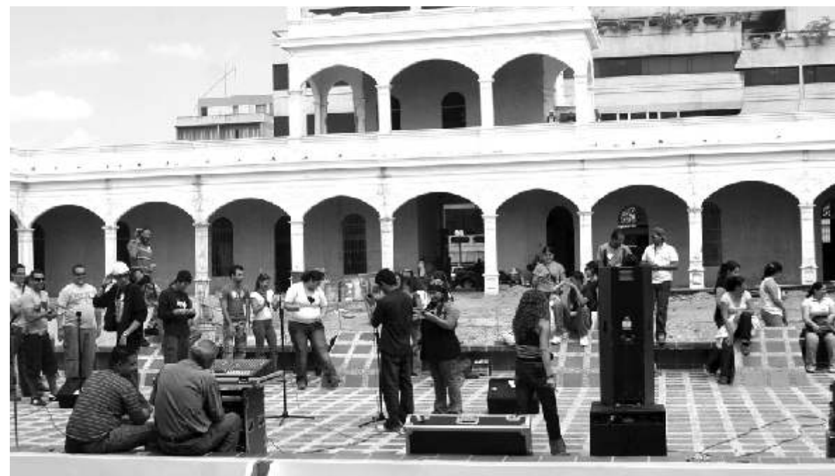
Las instalaciones del Cuartel se convirtieron en el aula de clases durante un día