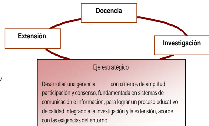
Mapa del Despliegue del Plan Estratégico