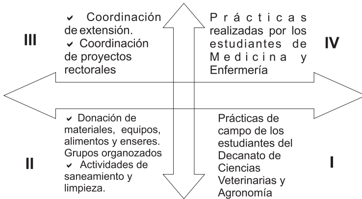
Gráfico N° 4. Cuadrantes del Aprendizaje Servicio. Análisis comparativo entre teorías y acciones ejecutadas por la UCLA.